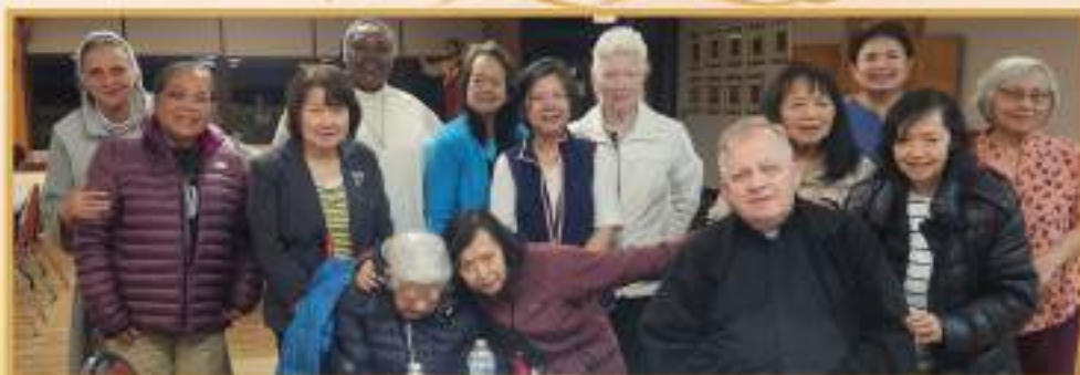
Dziękujemy za hojny darunek w wysokości $420